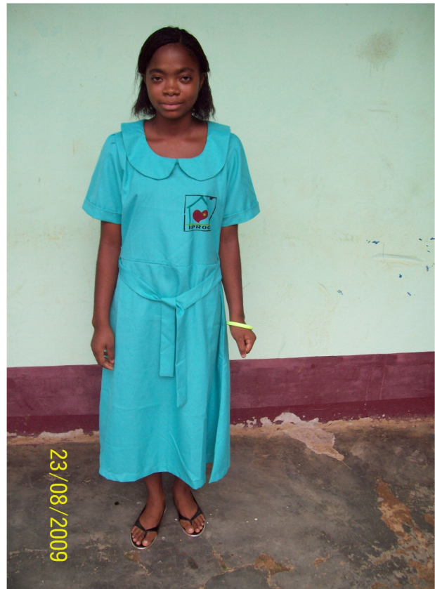
Une de nos jeunes filles

Pour ce faire une collaboration avec les tuteurs et représentants légaux des orphelins et les structures sociales existantes sur place est nécessaire.