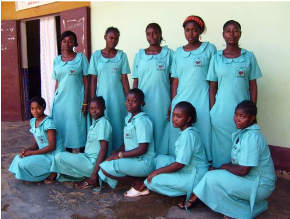
Les 10 jeunes filles orphelines sélectionnées à IPROC Obala