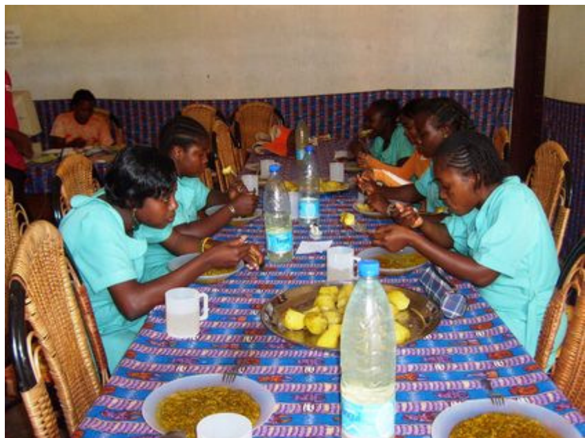
Les repas sont pris tous les jours au centre IPROC

Elles participeront ainsi activement à une chaîne de développement dans la région concernée par le projet.