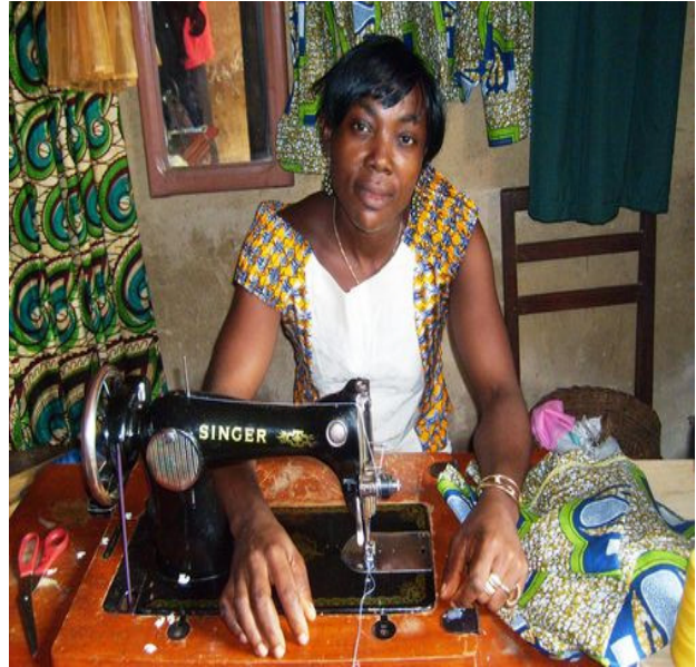
Une des formatrices

Sur la base des exemples connus localement, une analyse du rôle joué par la Femme au Cameroun sera effectuée et encadrée par des professionnels locaux.